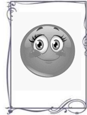
Name: Frau Schickel