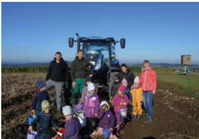
Kartoffelernte der Kindertagesstätte Burkersdorf

spitzengefühl“ und musste mit bestehendem Personal bewältigt werden. Nach zwei durch Corona-Einschränkungen geprägten Jahren waren die Kitas nun froh, im zweiten Halbjahr 2022 auch wieder gewohnte Aktivitäten wie Zuckertütenfest, Weihnachtsmarkt, Sportolympiaden, Zoo- und Wildparkbesuche durchführen zu dürfen. Für viele dieser Ausflüge standen den Kindern die Fahrzeuge des DRK-Fahrdienstes und vor allem der große Reisebus zur Verfügung.