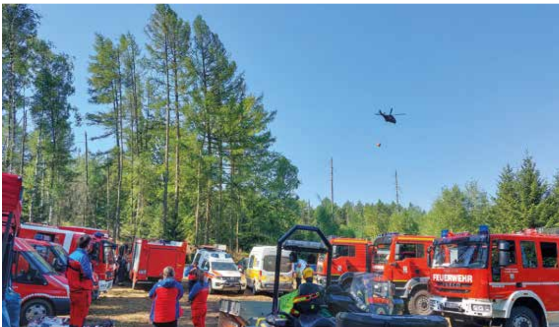
Waldbrand Sächsische Schweiz-Osterzgebirge