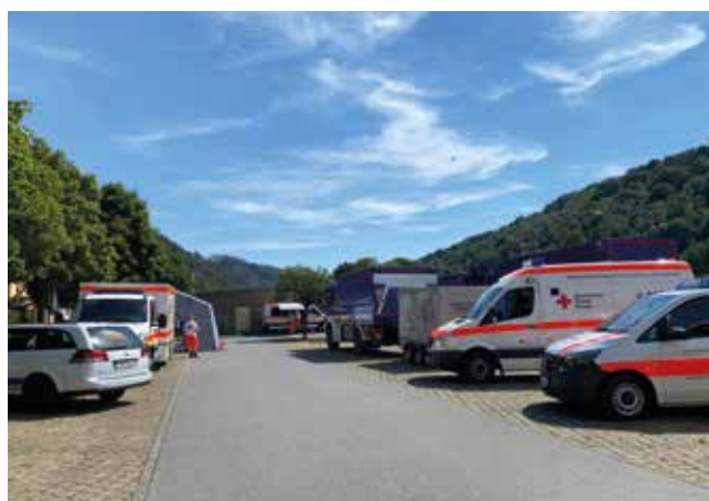
Waldbrand Sächsische Schweiz-Osterzgebirge

erfolgreichen Punktwertung im Bereich der JRK-Gruppen vertraten die Pretzschendorfer JRK-Gruppen und die Gruppe aus Glashütte den Kreisverband beim Landeswettbewerb in Wilsdruff.