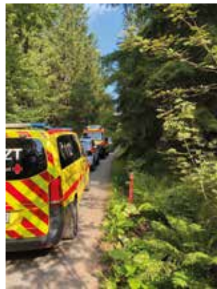
Rettungseinsatz in Altenberg