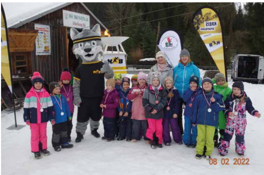
Weihnachtsfeier der Kindertagesstätte Burkersdorf