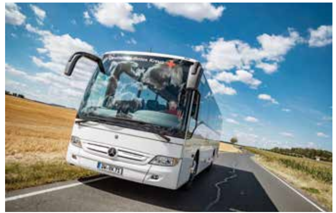
Reisebus des DRK-Fahrdienstes

Letztendlich kann der Bereich Fahrdienst trotz anfänglicher Schwierigkeiten zum Ende des Jahres eine gute wirtschaftliche Lage verzeichnen.