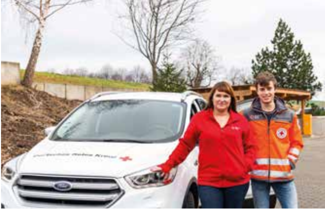
Fahrdienst des DRK KV Dippoldiswalde e. V.

Der Beginn des Jahres 2022 gestaltete sich für den Fahrdienst aufgrund von Corona und altersbedingten Abgängen personell schwierig.