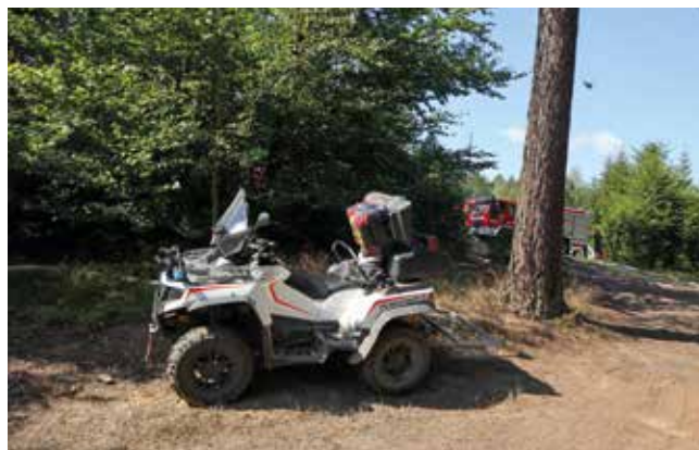
Waldbrand Sächsische Schweiz-Osterzgebirge

Ein Haupteinsatzgebiet war im vergangenen Jahr die Unterstützung der Feuerwehren beim Waldbrand in der Sächsischen Schweiz. Vom 28.07.2022 bis 16.08.2022 waren wir täglich mit mindestens zwei Kameraden vor Ort. Dies stellte eine enorme Herausforderung dar: Zum einen war dies ein für uns neues Einsatzszenario, zum anderen mussten wir über diesen langen Zeitraum, der in die Urlaubsmonate fiel, Personal für diesen Einsatz zur Verfügung stellen. Dies konnte jedoch zu jeder Zeit sichergestellt werden.