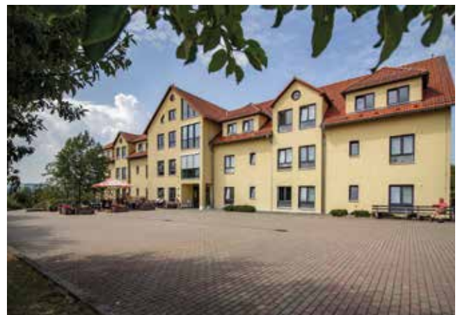
Stationäre Wohnform der Eingliederungshilfe „Am Taubenberg“

Wir freuen uns sehr, dass unser Haus zu jeder Zeit zu 100 % bewohnt werden konnte und durch alle Mitarbeiterinnen und Mitarbeiter eine tolle, für jeden Bewohner individuelle und qualitativ hochwertige Arbeit zum Wohle unserer Bewohner geleistet werden kann.